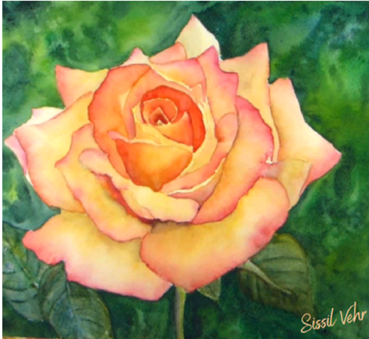
Rose — 2024