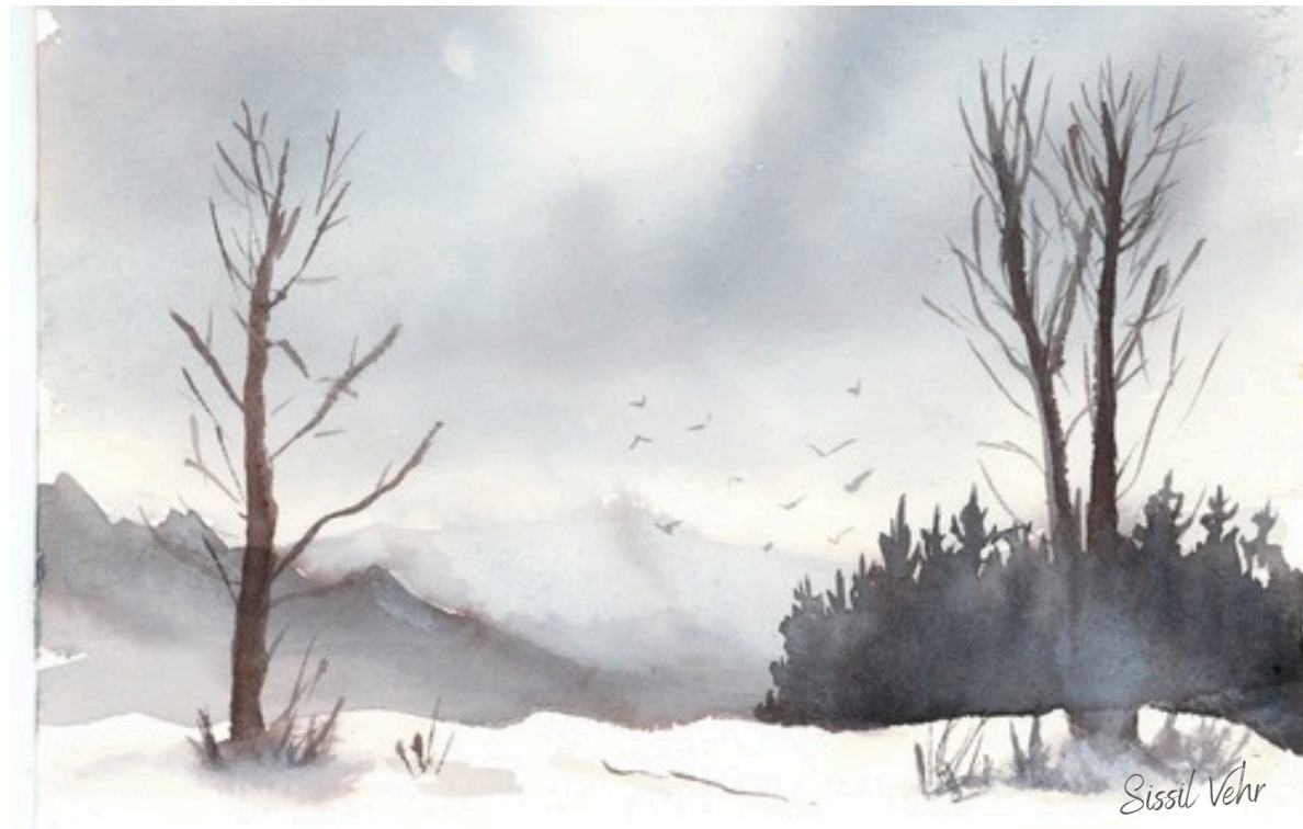
Blanc profond — 2024

Je privilégie des ambiances calmes, jouant avec la lumière et les couleurs pour suggérer un moment suspendu.