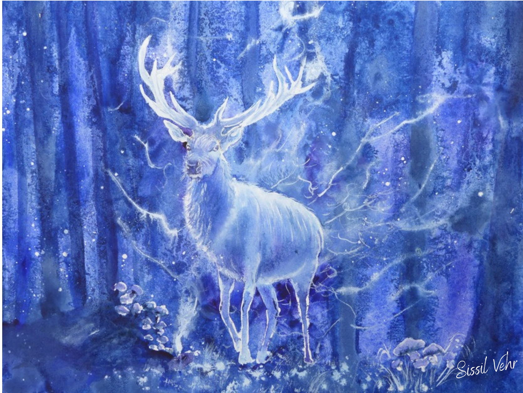
L'Esprit des forêts... — 2023