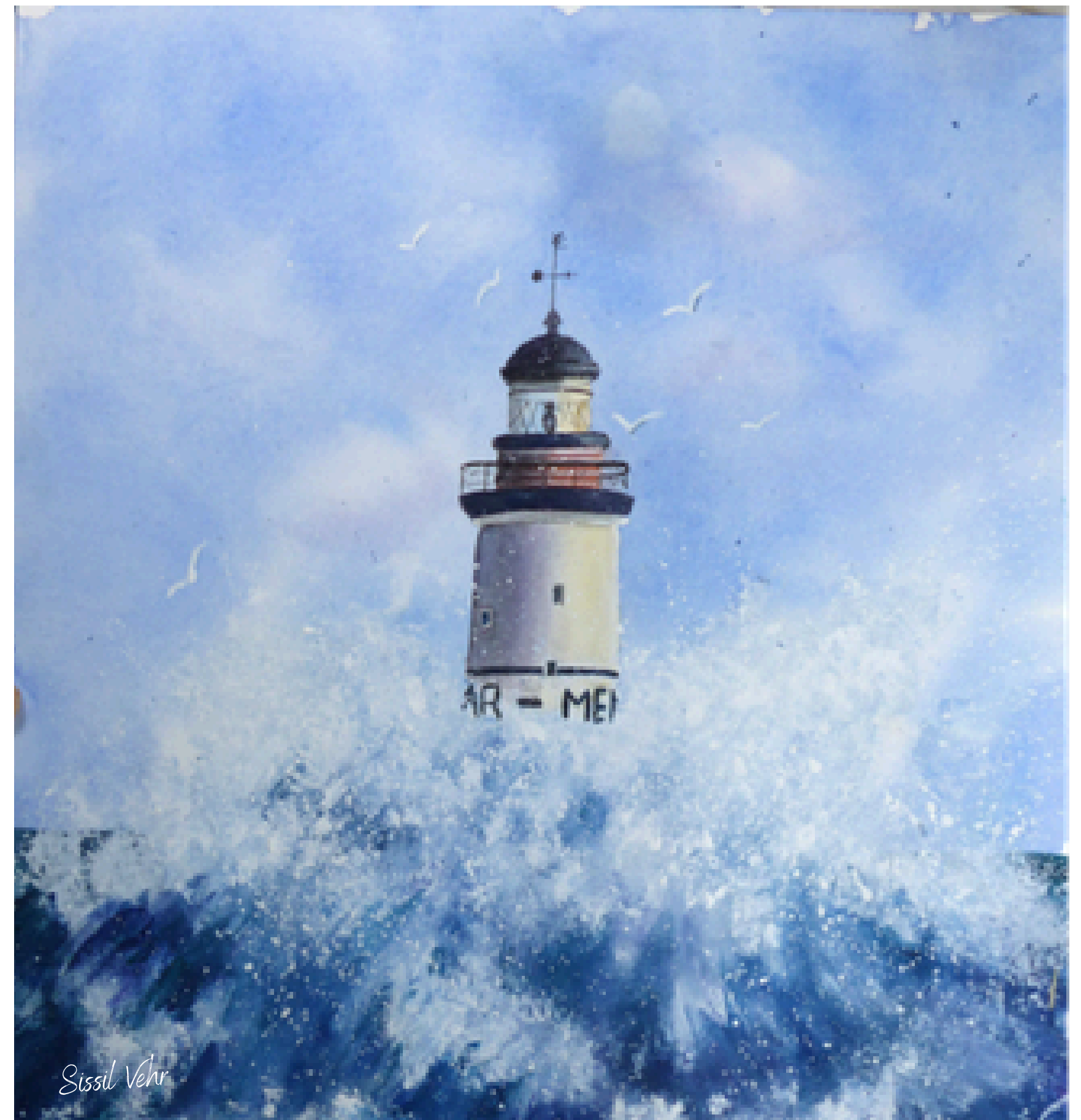
Ar Men , le gardien — 2022

Le paysage devient mouvement, matière, sensation