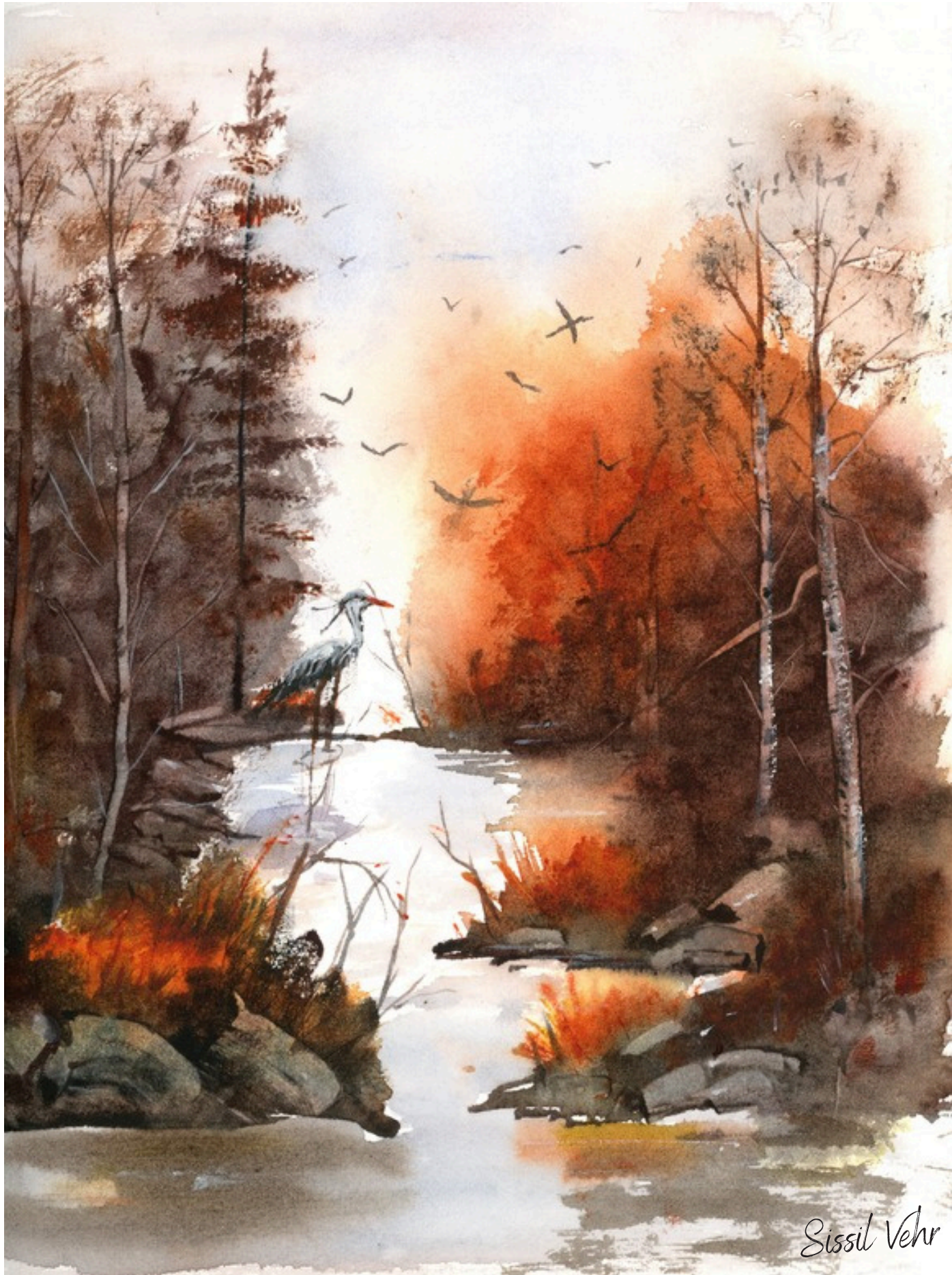
Héron à l'aube — 2025