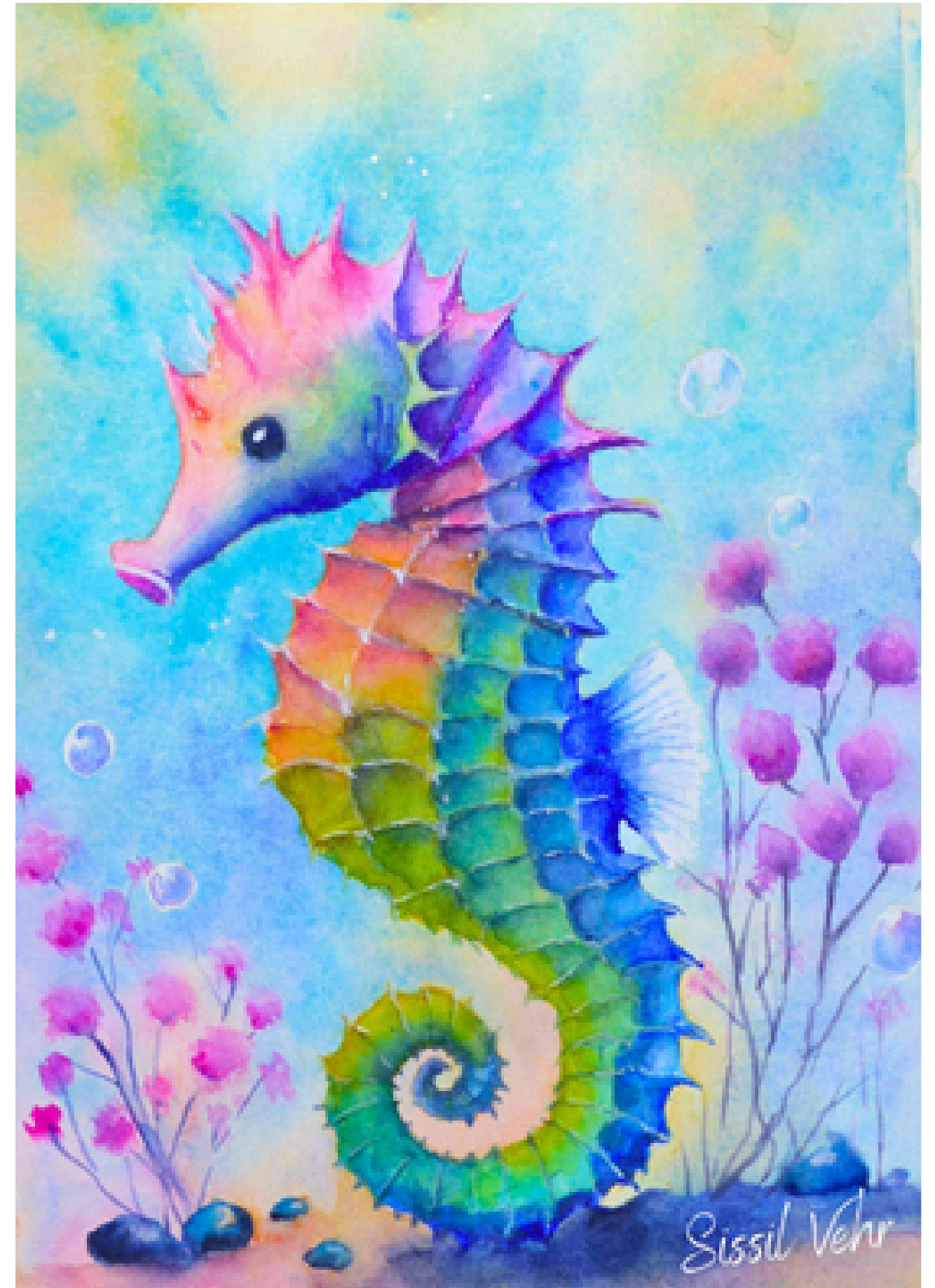
Arc-en-ciel des mers — 2024

Ils marchent, nagent, volent, rampent ou se posent un instant, souvent sans qu'on les remarque. Papillons, escargots, hippocampes, chats rêveurs ou oiseaux d'hiver : ils partagent notre monde, l'habitent à leur manière, avec une grâce silencieuse.