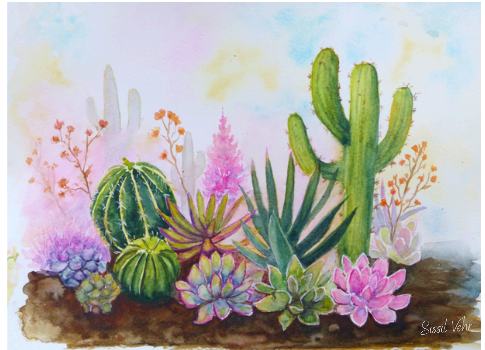
Éclats d'aridité — 2024

L'aquarelle m'offre la transparence, les fusions, les respirations nécessaires pour évoquer ces formes éphémères sans jamais les figer. Chaque peinture est un instant suspendu, une invitation à ralentir — et à regarder autrement.