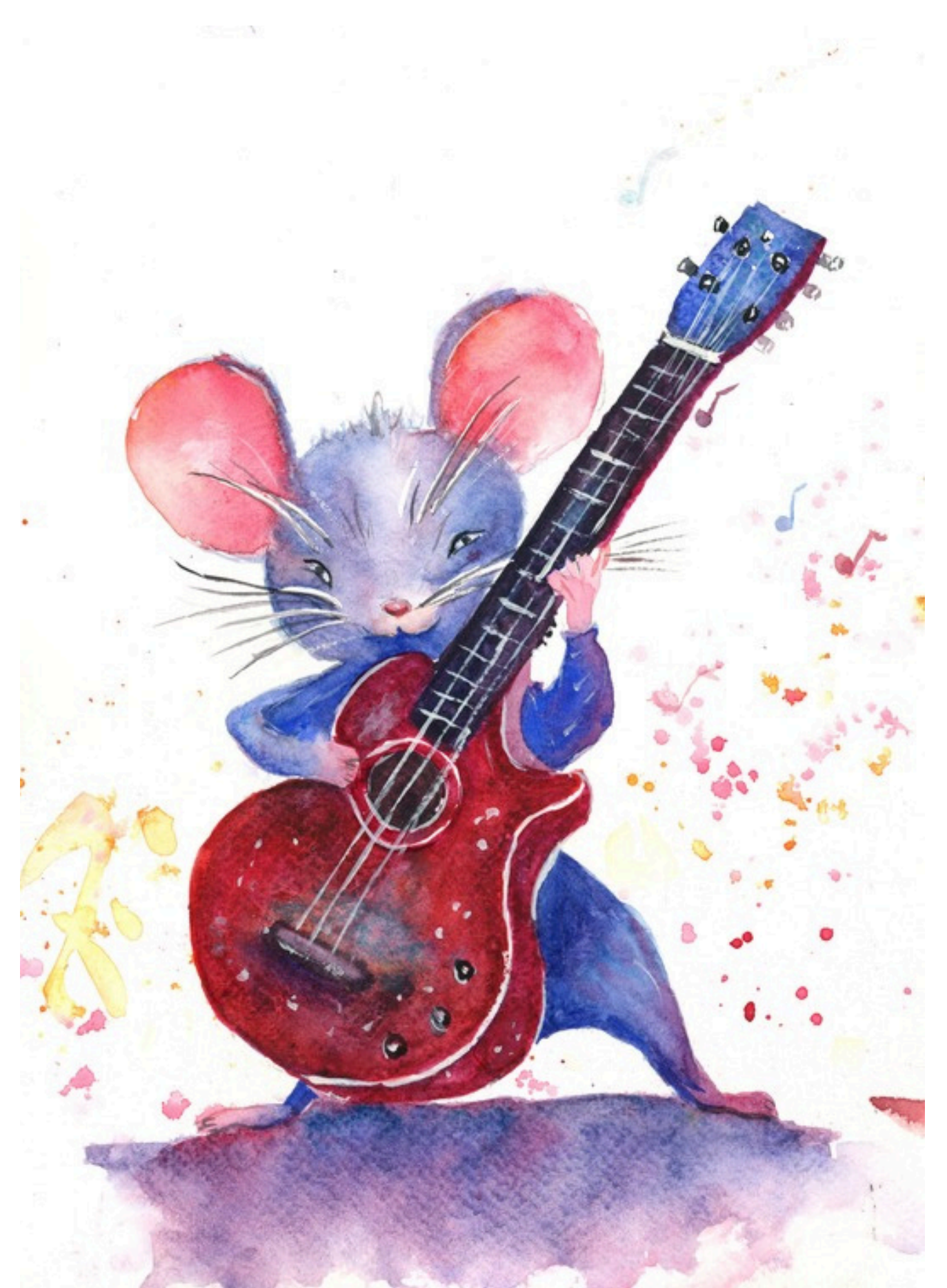
Souris en scène — 2024