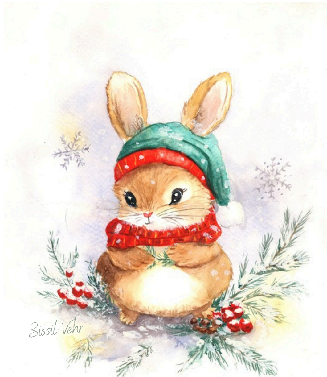
Lapin de Noël — 2024

Certains vivent tout près, dans un jardin ou sur un canapé ; d'autres surgissent dans l'imaginaire, porteurs de douceur ou de mystère.