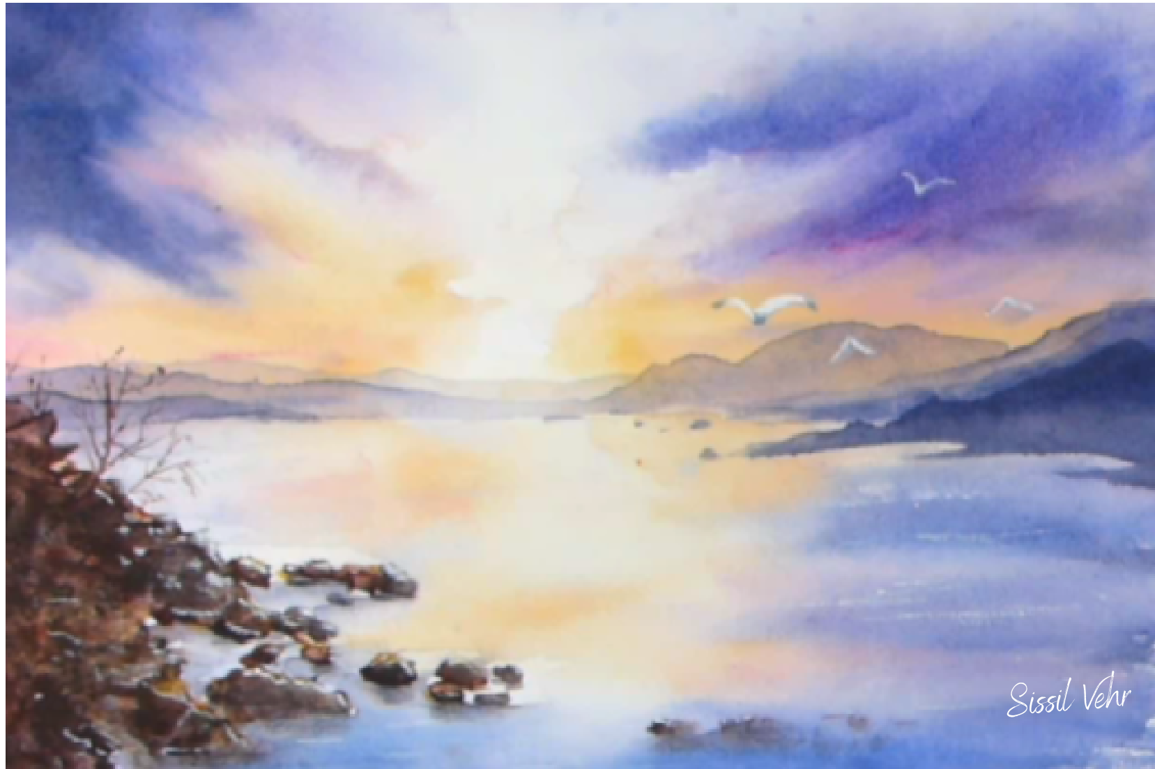
Lointain de lumière — 2026

À travers ces paysages, je cherche à capter la fluidité de l'eau, l'horizon mouvant et les reflets changeants du ciel