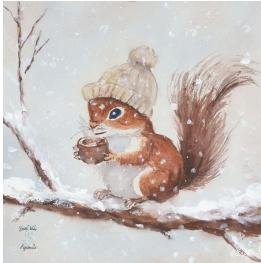
Pause au creux de l'hiver — 2025

Ils marchent, nagent, volent, rampent ou se posent un instant, souvent sans qu'on les remarque. Papillons, escargots, hippocampes, chats rêveurs ou oiseaux d'hiver : ils partagent notre monde, l'habitent à leur manière, avec une grâce silencieuse.