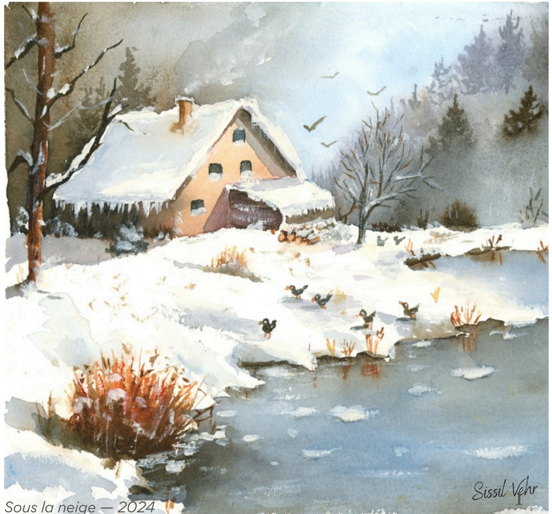
Sous la neige — 2024