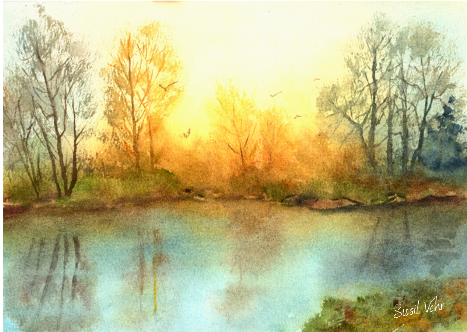
Eau et lumière — 2025

Mon travail à l'aquarelle explore la lumière, les silences du paysage et les atmosphères sensibles.