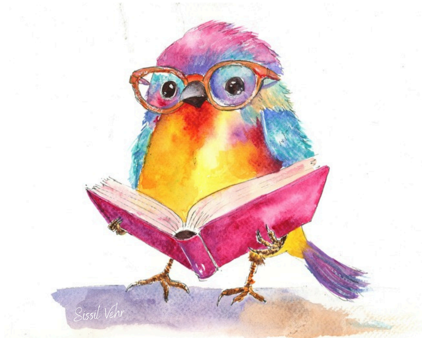
Il était une plume... — 2025

Cette série plonge dans des mondes imaginaires, parfois doux, parfois étranges, toujours teintés de poésie. Je laisse ici plus de place à l'interprétation, à la narration, à la magie.