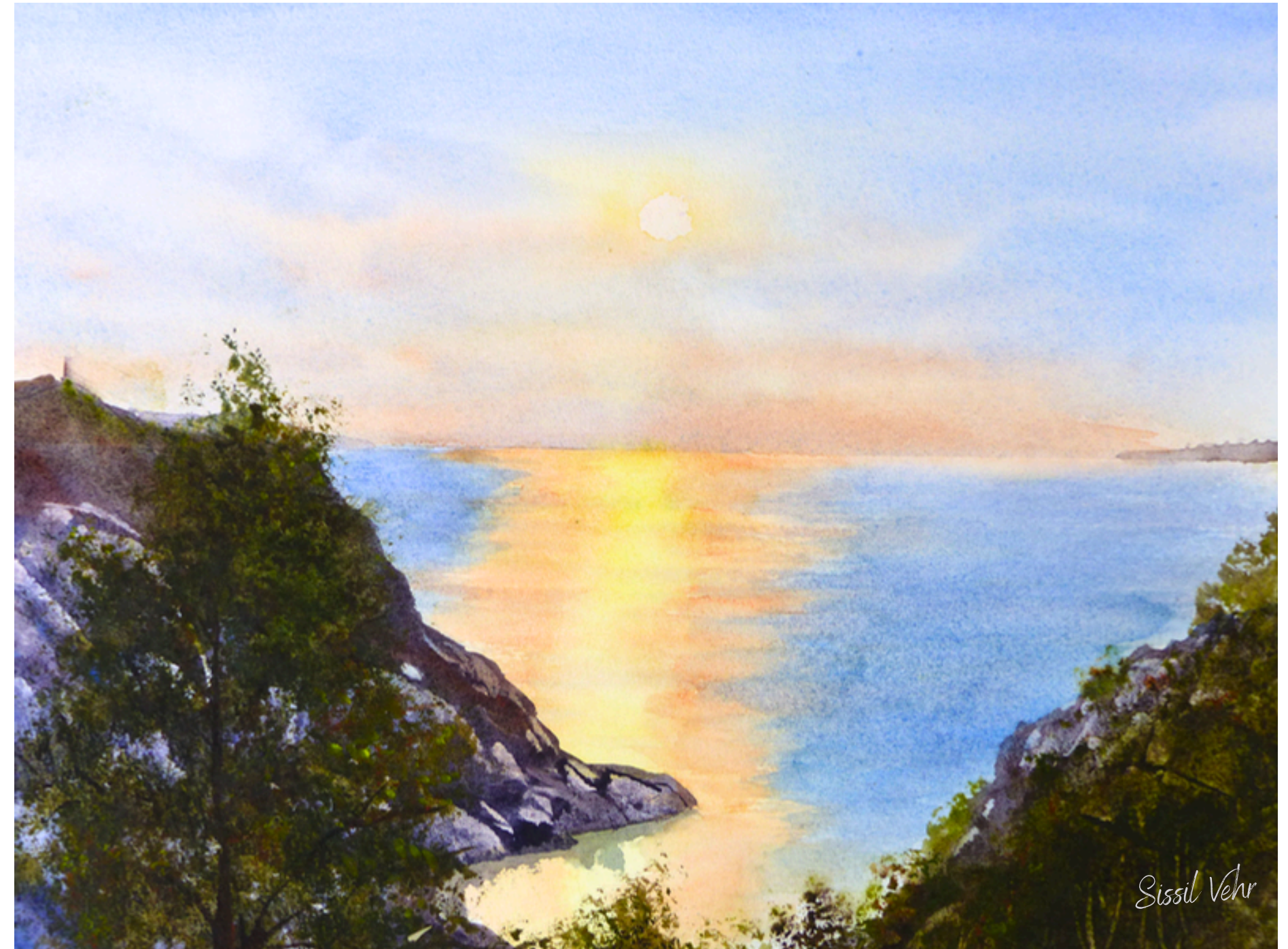
Reflets du soir — 2021

L'aquarelle me permet de suggérer le mouvement comme l'apaisement, entre lumière vibrante et silence du rivage.