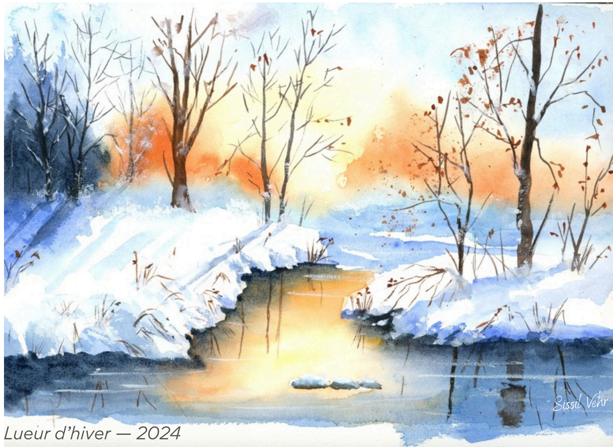
Lueur d'hiver — 2024

L'aquarelle me permet de capter des reflets, des silences, des brumes ou des teintes diffuses, avec spontanéité et douceur.