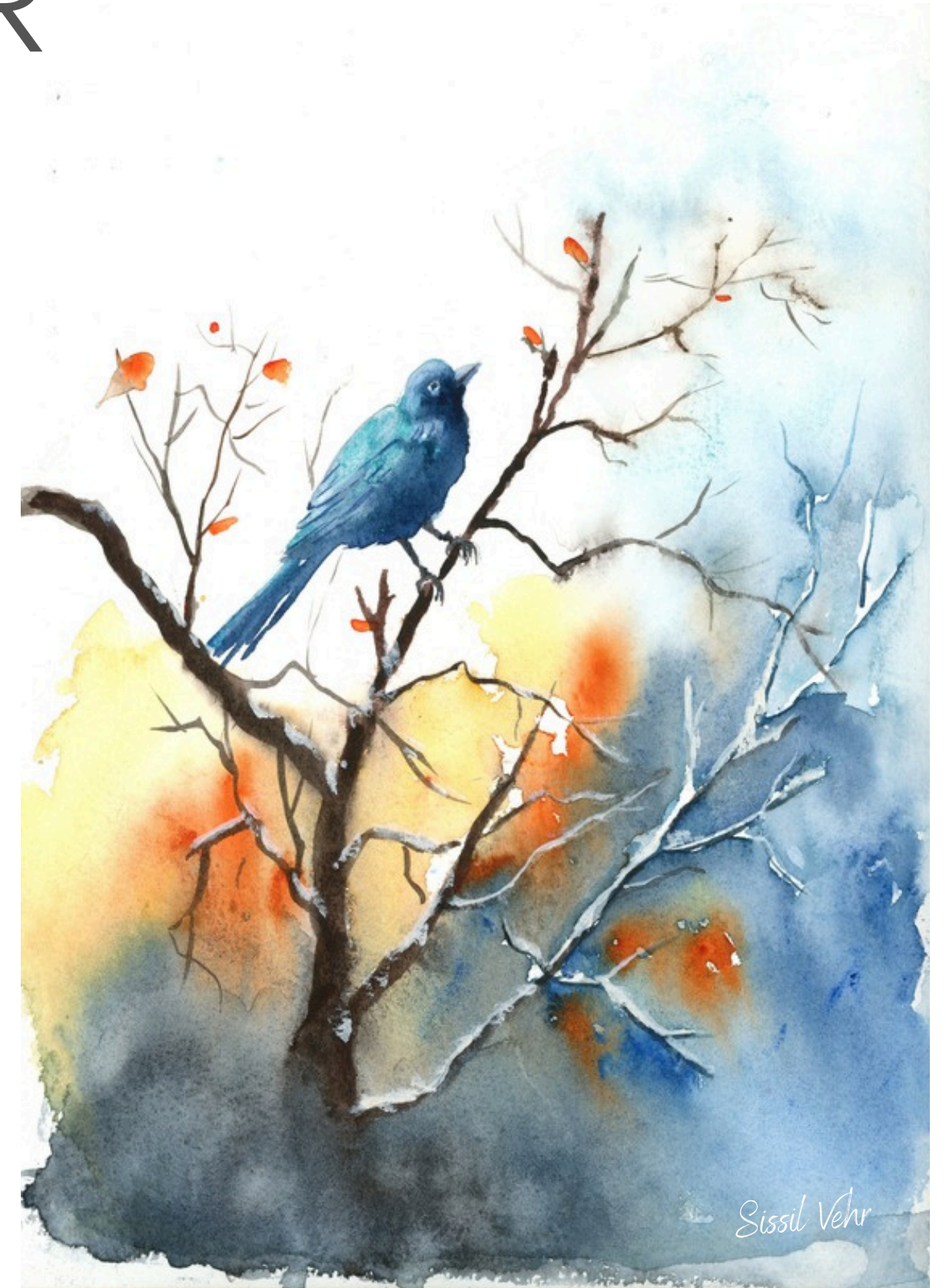
L'oiseau bleu — 2025

À travers cette série, je rends hommage à ces petits vivants qu'on oublie trop souvent — mais qui sont là, tout autour de nous.