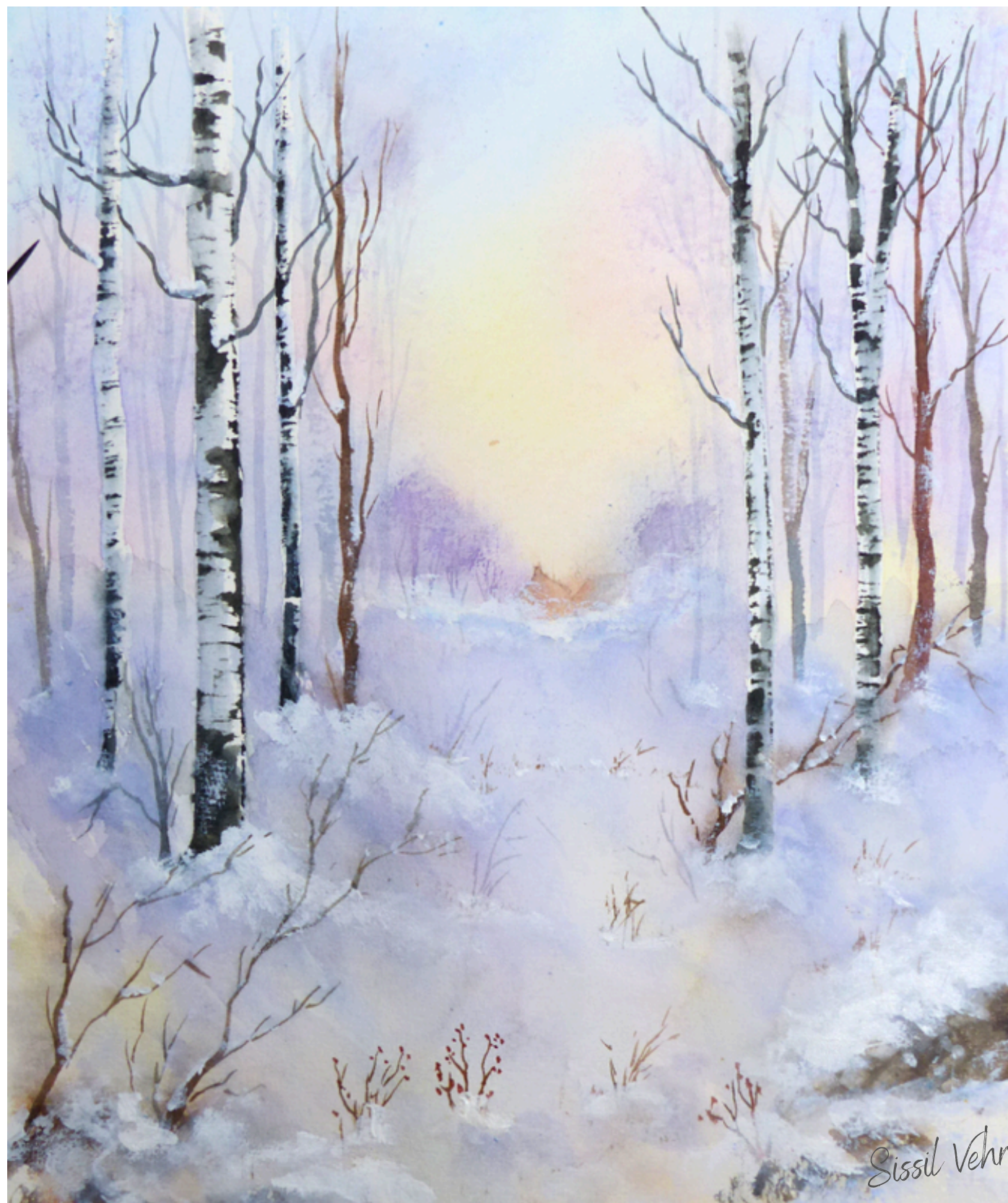
Blancs murmures — 2022

Mes aquarelles peuvent voyager plus loin... Si certaines résonnent avec vos projets, je serais ravie d'échanger autour d'une collaboration ou d'un partage sous licence.