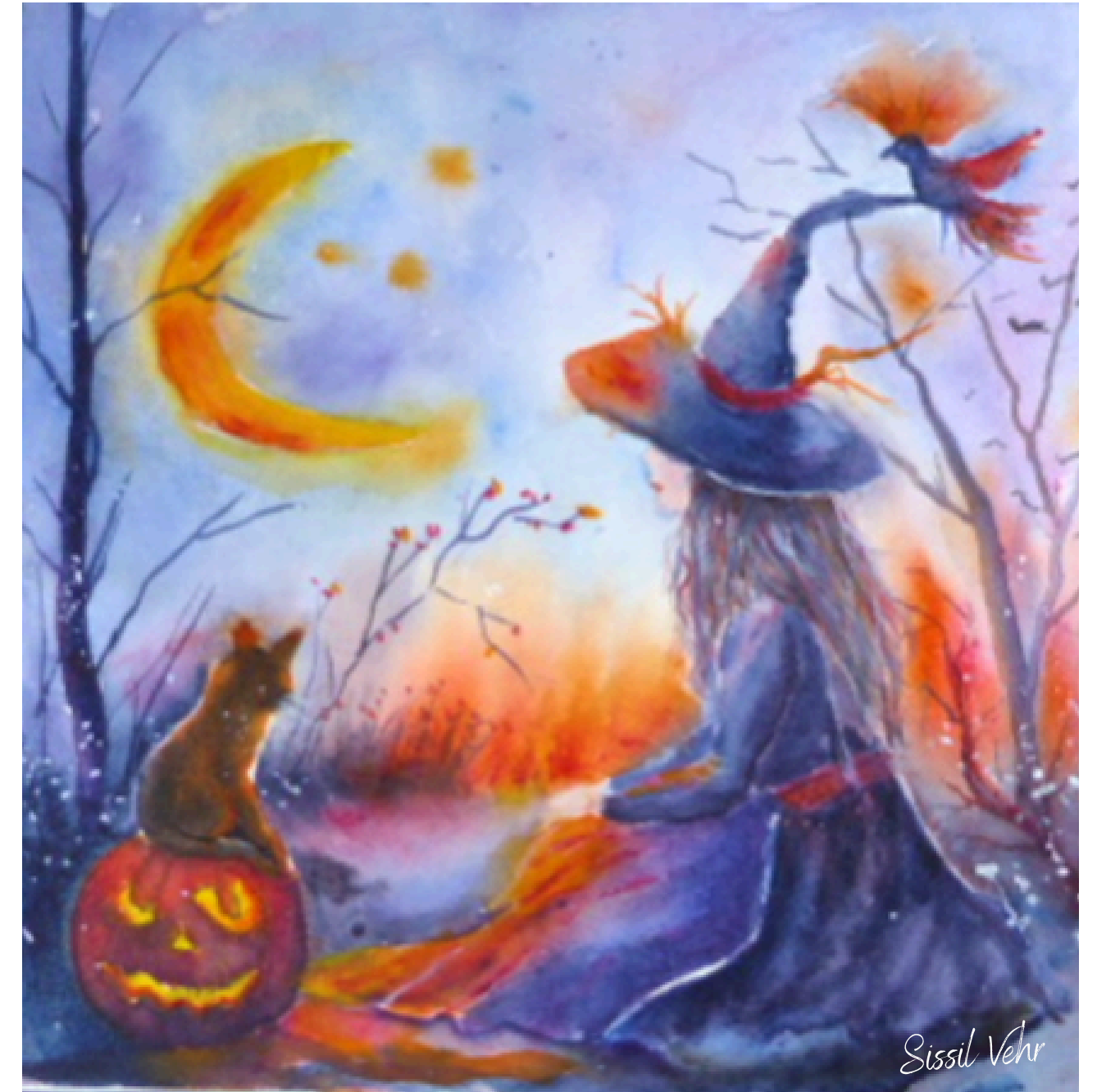
Sortilèges d'automne — 2024

Cette série plonge dans des mondes imaginaires, parfois doux, parfois étranges, toujours teintés de poésie. Je laisse ici plus de place à l'interprétation, à la narration, à la magie.