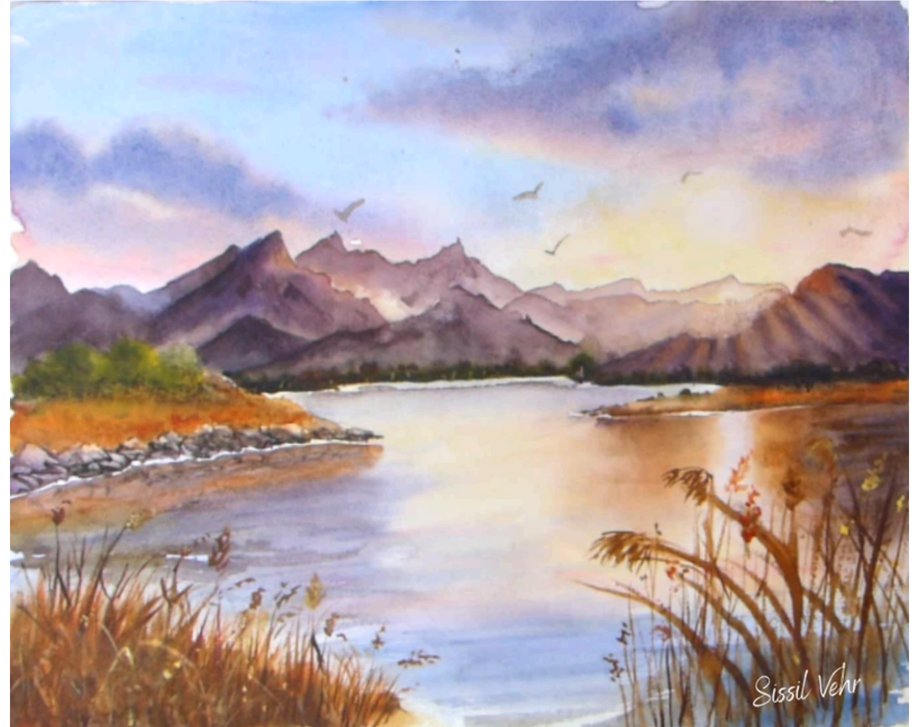
Lumière d'après l'orage — 2024