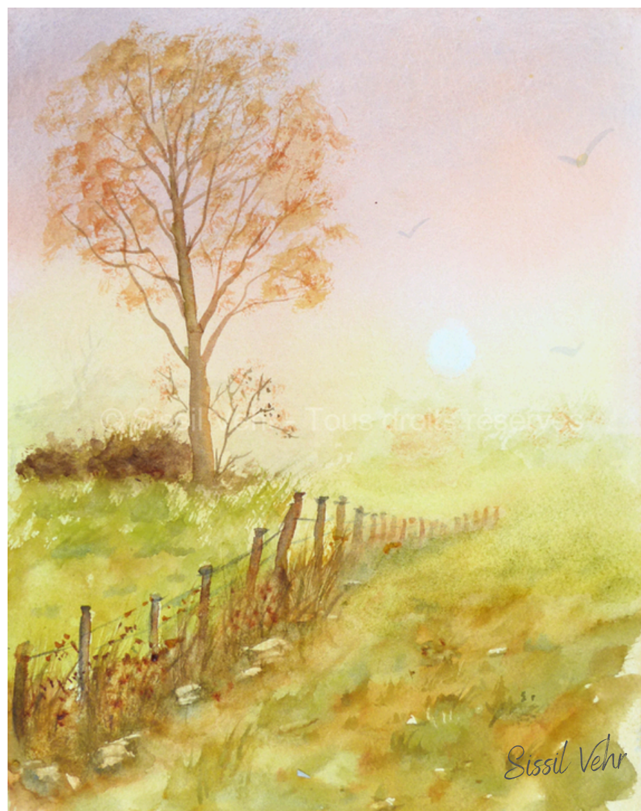
Brume — 2020