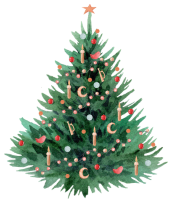
un sapin de Noël