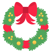
une couronne de Noël