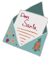
une lettre pour le Père Noël