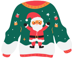
un pull de Noël