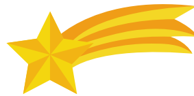
une étoile filante