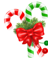
un sucre d'orge