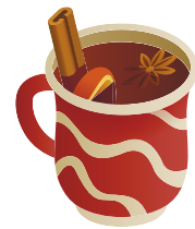
du vin chaud