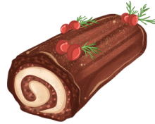
une bûche de Noël