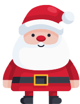
le Père Noël