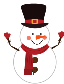
un bonhomme de neige