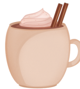
du chocolat chaud