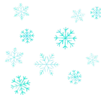
un flocon de neige