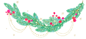
une guirlande (lumineuse)