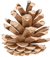
une pomme de pin