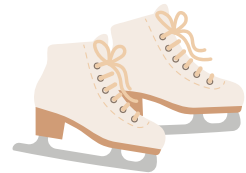
des patins à glace