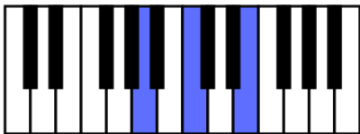
Am = Accord de la mineur