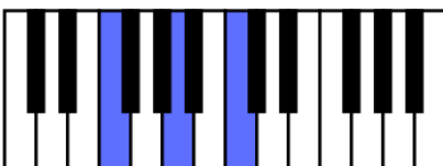
F = Accord de Fa