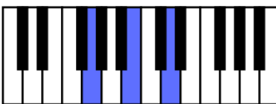
G = Accord de Sol