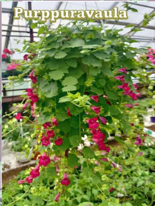
Verbena / rautayrtti