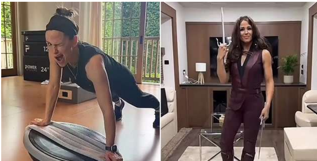
Jennifer Garner utilise cette méthode pour perdre du gras après 50 ans

C'est la fameuse méthode que les actrices utilisent pour perdre du gras rapidement tout en préservant leurs muscles , notamment après une grossesse, lorsqu'elles doivent se préparer pour un tournage.