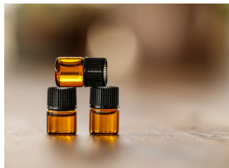
BESTELLUNG OHNE KUNDENKONTO

Es gibt unterschiedliche Wege zu starten. Bis auf sehr wenige spezielle Themen, lohnt es sich immer mit einem Starter-Set zu beginnen.