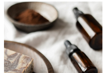
STARTER-SET MIT KUNDENKONTO