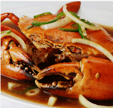
3/ Crabe sauce