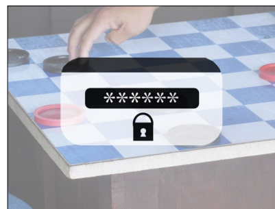
L'image nécessite un code d'accès