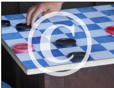
L'image a un filigrane ou un tatouage numérique