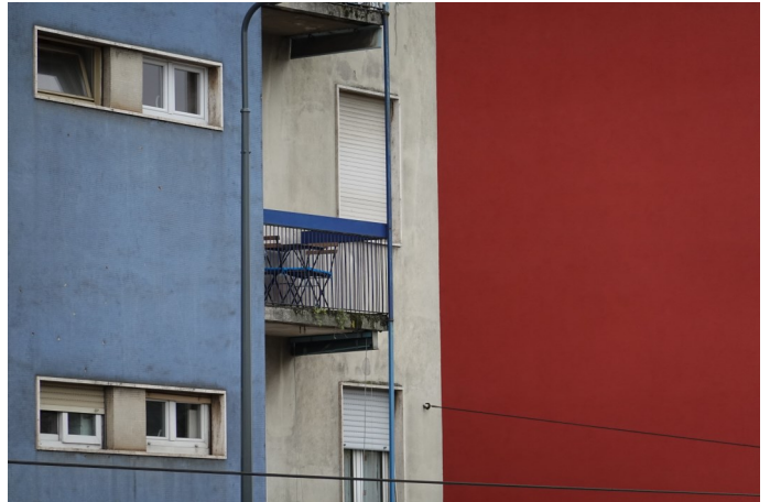
Blue white & red Bridge along the Naviglio Grande Milan par Guilhem Vellut sous licence: Creative Commons CC BY 2.0.

Vous devez d'abord indiquer le titre de l'œuvre (s'il y a lieu). Ensuite, vous devez citer l'auteur de l'œuvre. Même dans le cas d'une œuvre du domaine public, il est toujours encouragé de citer l'auteur sous une image. Finalement, vous terminez votre référence en indiquant le type de licence correspondant (s'il y a lieu). Dans le cas où il n'y aurait aucune licence, vous pouvez seulement indiquer le titre de l'œuvre et son auteur.