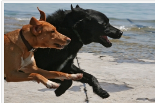
Les chiens aiment se faire la malle

juillet 16, 2009 à 3:24 · Classé sous News Wamiz, conso · Taggé anti-fugue, chien, collier GPS, collier pour chien, toutou