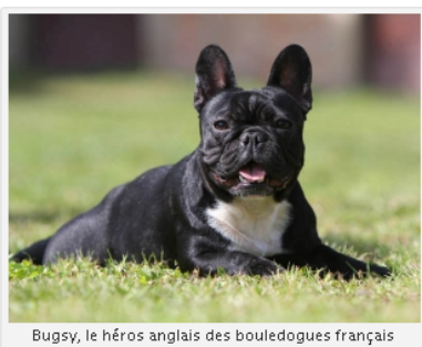
Bugsy, le héros anglais des bouledogues français

Voyant sa maîtresse, enceinte et atteinte de diabète type 1, ne pas se réveiller après être allée se coucher, Bugsy , un bouledogue français a donné l'alerte. Aboyant jusqu'à réveiller son colocataire, celui-ci a prévenu les secours. La jeune femme se rappelle juste s'être réveillée entourée de médecins. Merci qui ? Merci Bugsy !