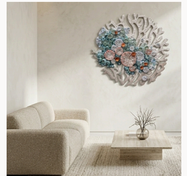
Guardians of Rebirth, 2026 Sensory Metamosaic 73,7 × 92,1 cm Under the Sea, Collection