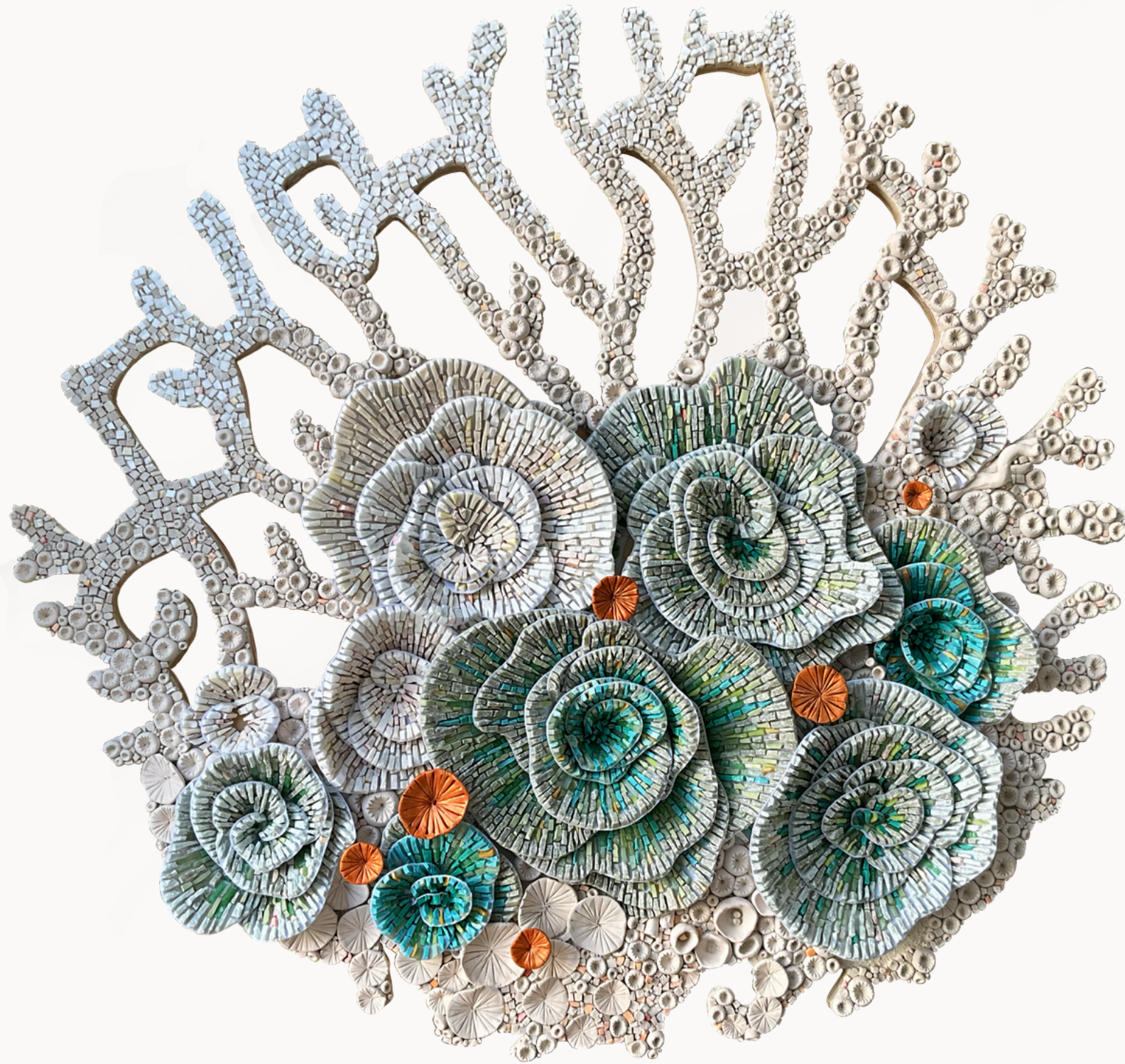
The First Breath of the Reef, 2026 Sensory Metamosaic 80 × 80 cm Under the Sea, Collection

Ideal para espacios que buscan transmitir calma y profundidad, esta obra introduce una energía sutil de inicio y posibilidad, convirtiéndose en un punto de conexión entre naturaleza y arquitectura.