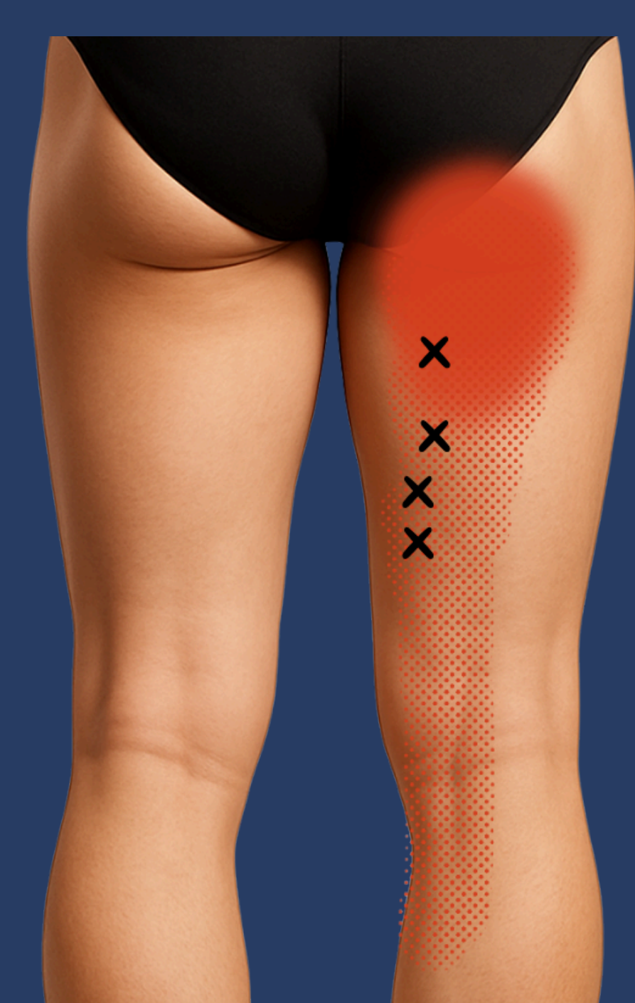
SEMI MEMBRANEUX SEMI TENDINEUX