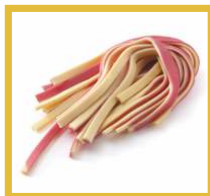
SCIALATIELLO BIANCO ROSSO