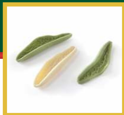
FOGLIE D'ULIVO BIANCO E VERDE