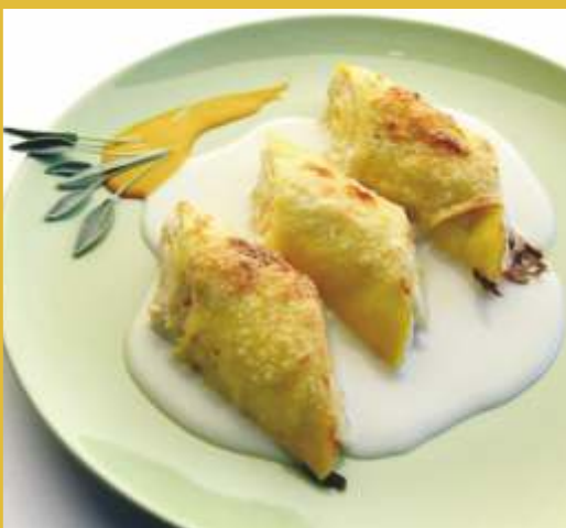
CRESPELLE CON BESCAMELLA