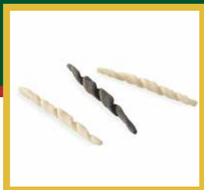
TROFIE BIANCHE NERE