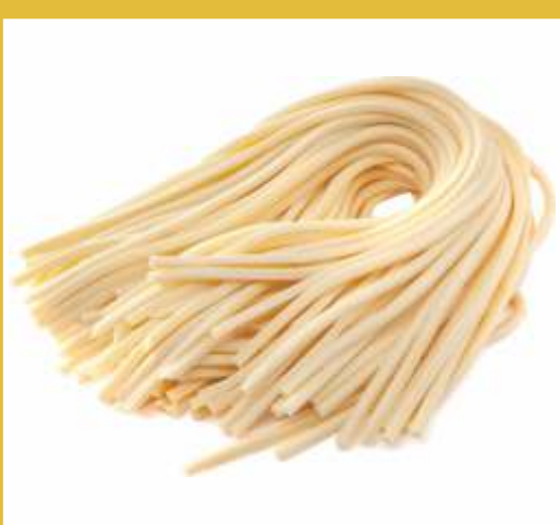
SPAGHETTI ALLA CHITARRA