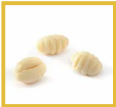
GNOCCHI DI PATATE