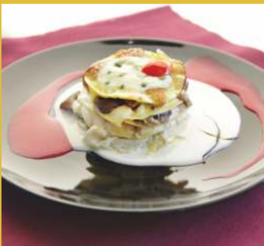
LASAGNETTA CON MELANZANE E PROVOLA AL GRATIN