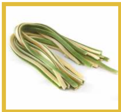
SCIALATIELLO BIANCO VERDE