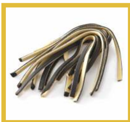
SCIALATIELLO BIANCO NERO