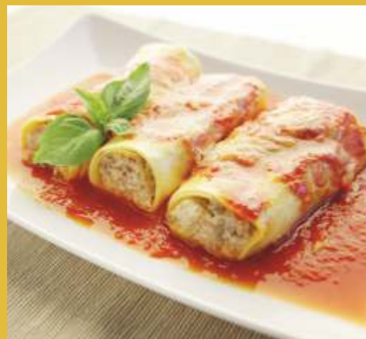
CANNELLONI AL SUGO