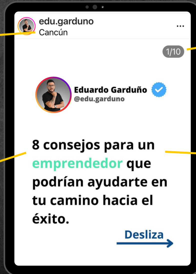
Imagen / título Si es imagen, que sea de la más alta calidad. Si es ilustración, que sea alusiva al contenido. Y si es título que sea atractivo y útil