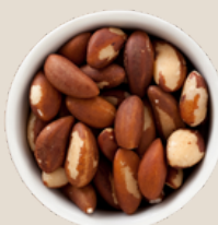
Castanha de caju