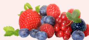
Frutos vermelhos congelados