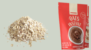
Flocos finos de aveia + farinha de aveia com sabor a chocolate