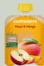
Saqueta 100% fruta