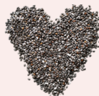
Sementes de chia