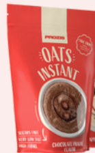
Farinha de aveia com sabor a bolacha maria