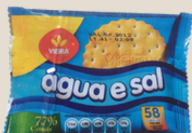
Bolachas de água e sal