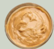
Manteiga de amendoim