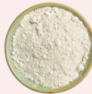
Farinha de aveia integral sem sabor