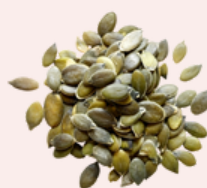
Sementes de abóbora