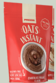
Farinha de aveia com sabor a baunilha