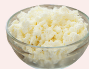
Queijo quark / Queijo fresco batido magro