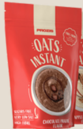
Farinha de aveia com sabor a chocolate