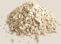
Flocos de aveia