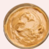
Manteiga de amêndoa