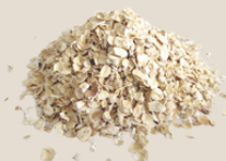
Flocos finos de aveia