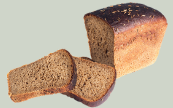
Pão de forma