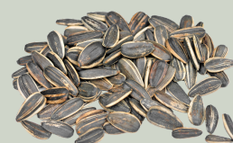
Sementes de girassol