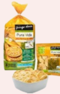
Tortitas de milho