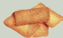
Tostas extra finas