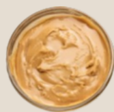
Manteiga de amendoim