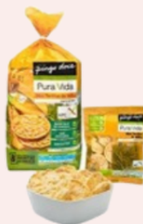
Tortitas de milho