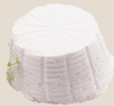
Queijo fresco magro