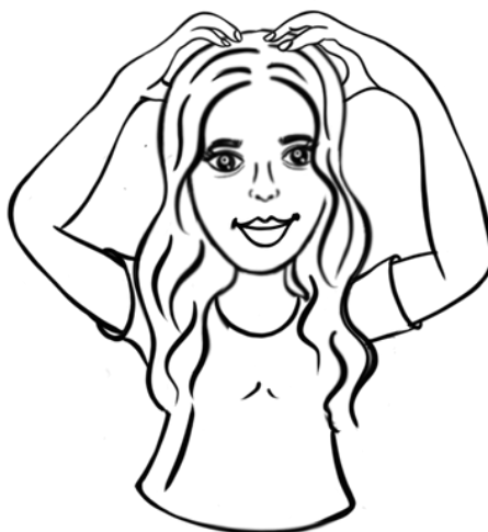
Toppen av huvudet