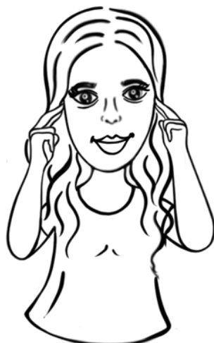
Sidan av ögonen, strax under tinningen