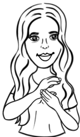
Karatepunkten (Sidan av handen)