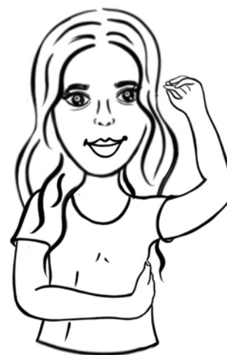
Under armen i linje med BH-linjen