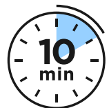
MÁSCARA PURIFICANTE DE ARGILA COM MENTA