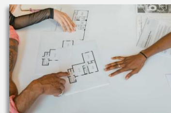
Ergonomie de conception

Vous ne trouvez pas exactement ce dont vous avez besoin ?