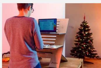
La QVCT par l'ergonomie