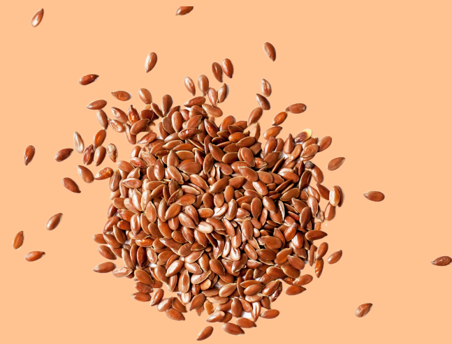
Graines de lin