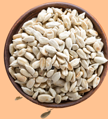
Graines de tournesol