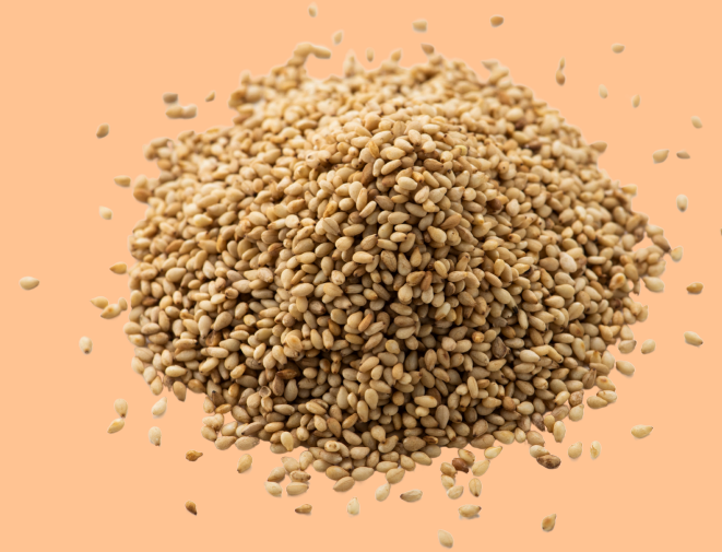
Graines de sésame