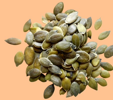
Graines de courge