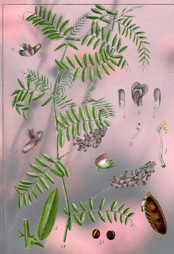
Vogelwiede, Vicia cracca.