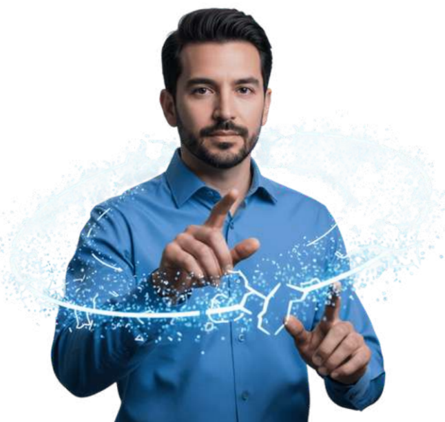
Análisis técnico por Santiago, Consultor Ejecutivo Senior · STRUCTURA PRO™

Mayoría en columna "ALERTA": Detente. Estás operando bajo suposiciones peligrosas. Reestructurar ahora te ahorrará meses de frustración y dinero perdido.