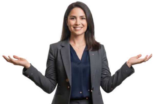
Diagnóstico estratégico por Mariana Directora Estratégica · STRUCTURA PRO™

Emprendedor, ya tienes el diagnóstico. Ahora tienes dos opciones: guardar este documento en una carpeta o activar el sistema que transformará tu idea en una operación sólida. En STRUCTURA PRO™ no solo evaluamos, construimos contigo."