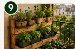
CULTURE EN ESCALIER Structure en niveaux pour un maximum de plantes.