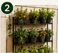
MUR VÉGÉTAL Idéal pour les petits balcons étroits.