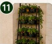
ÉCHELLE POTAGÈRE Originale, décorative et très pratique.