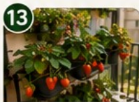
FRAISIER Suspendus Des fraises fraîches même sur un petit balcon !