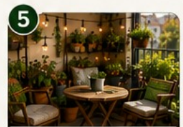
COIN POTAGER COSY Un espace détente et productif à la fois.