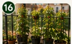
PLANTES GRIMPANTES Haricots, pois, concombres : vers le haut pour gagner de la place.