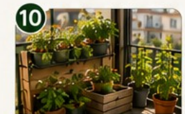
CAISSES EN BOIS Économique, esthétique et modulable.