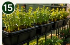
SALADES EN JARDINIÈRES Des récoltes rapides et régulières.