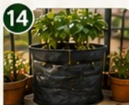
POMMES DE TERRE EN SAC Facile, ludique et très productif.