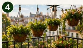
SUSPENSIONS Libère le sol tout en restant productif.