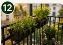
AROMATIQUES À PORTÉE DE MAIN Tes herbes préférées toujours sous la main !