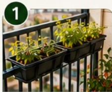
JARDINIÈRES SUR GARDE-CORPS Gagne de la place et profite du soleil.