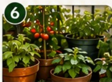
GRANDS POTS Parfait pour les légumes gourmands (tomates, poivrons, aubergines).