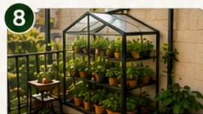
MINI SERRE DE BALCON Prolonge la saison et protège les cultures.