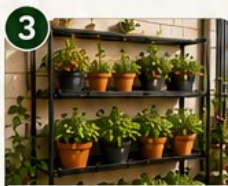
ÉTAGÈRES À PLANTES Optimise la hauteur et multiplie les cultures.