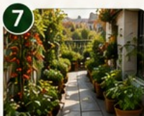
POTAGER LINÉAIRE Le long d'un mur ou de la rambarde.