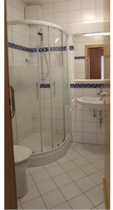
Verschiedene Zimmer im Haupthaus