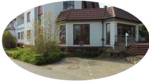
Hotel mit 46 Gäste- zimmern