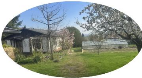
Gärtnerei (Bauland) 3.2 Tqm