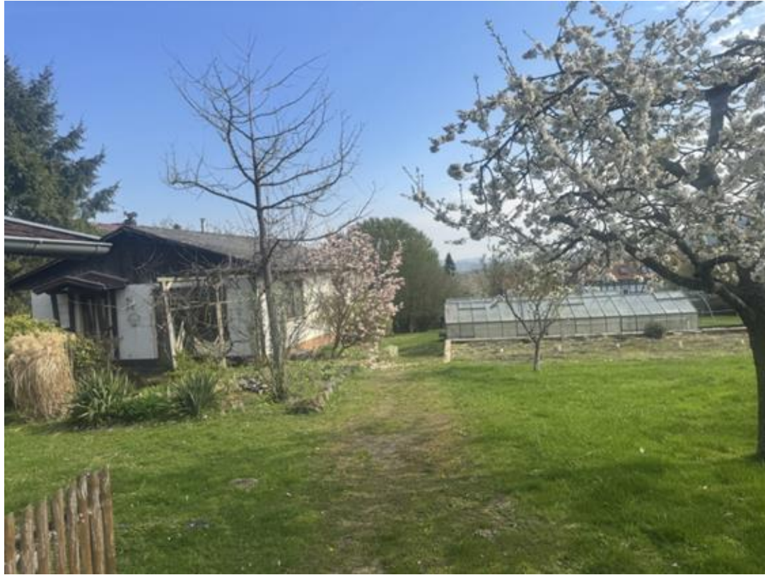
Gärtnerei Grundstück, Bauland mit 3200 qm Größe.