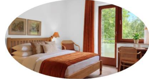
Wohnen und Leben