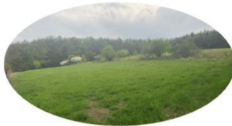
Ackerland 3.3 Tqm