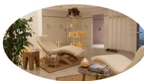
Relax- und Wohlfühlort