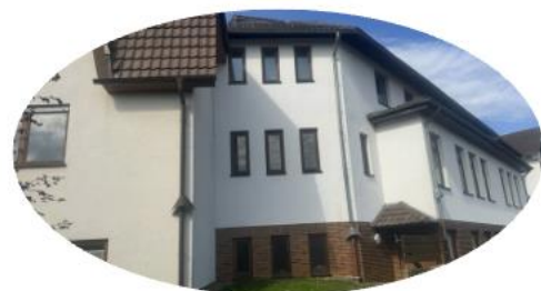
Personalhaus mit 6 Wohnungen