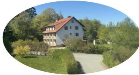
Gästehaus mit 4 Whg und 12 Zimmern