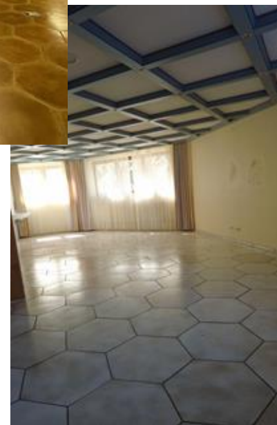
Verschiedene Seminar- und Gruppenräume