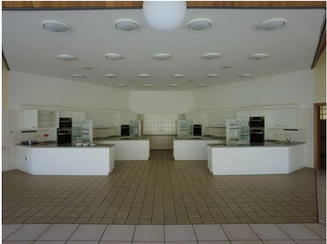
Großküche und Lehrküche im Haupthaus