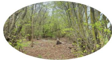
Wald 18 Tqm