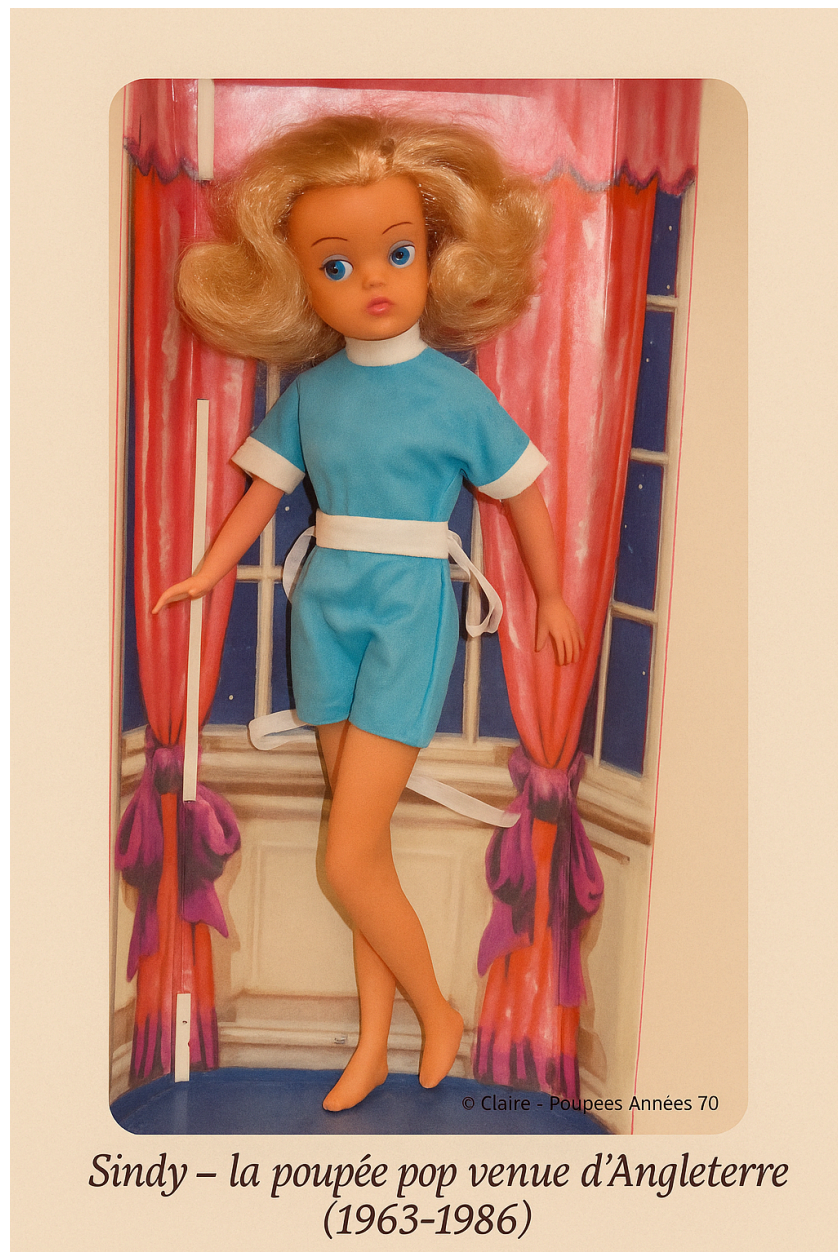
Sindy – la poupée pop venue d'Angleterre (1963-1986)

🇬🇧 Si tu as une Sindy des années 70, montre-la : ses robes colorées n'attendent qu'un regard neuf.