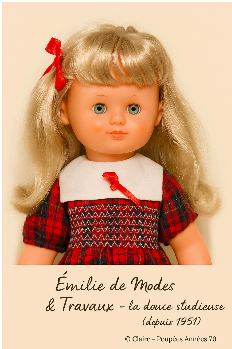
Émilie de Modes & Travaux - la douce studieuse (depuis 1951)

📷 Si ton Émilie est encore bien rangée dans une boîte à chaussures, Claire aimerait la revoir.