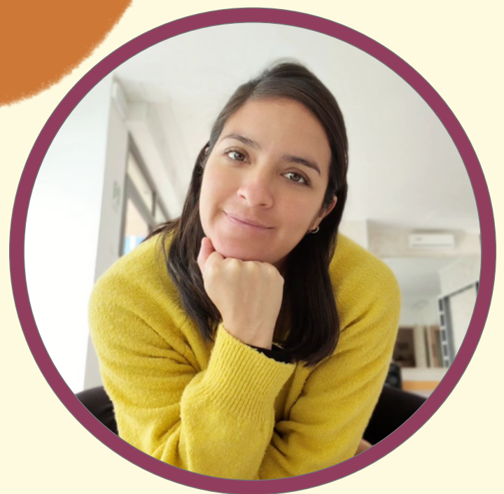
Natalia Cadena @Kimatiganatura