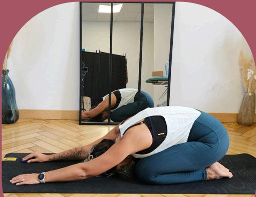
position de l'enfant

fais chaque position 30 sec par côté pense à calmer ta respiration