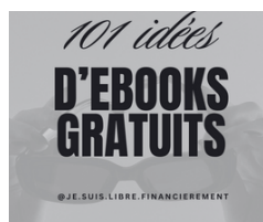
101 IDEES DE PRODUIT DIGITAUX