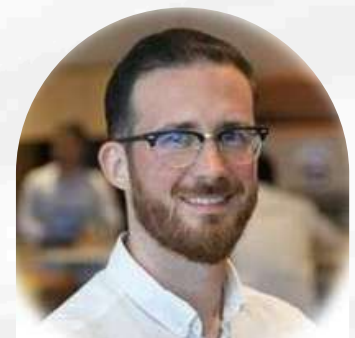
Kevin Expert Prospection B2B Linkedin