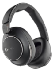
Seria Poly Voyager Surround 4