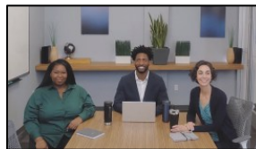
Încadrare de grup

Proiectat pentru performanțe audio și video excelente în săli mici, cu simplitatea unei bare video USB și experiență Poly DirectorAI.