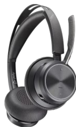
Seria Poly Voyager Focus 2