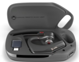
Seria Poly Voyager Legend