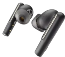
Seria Poly Voyager Free 60