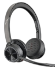
Seria Poly Voyager 4300 UC