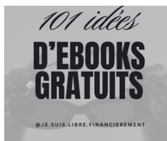
101 IDEES DE PRODUIT DIGITAUX