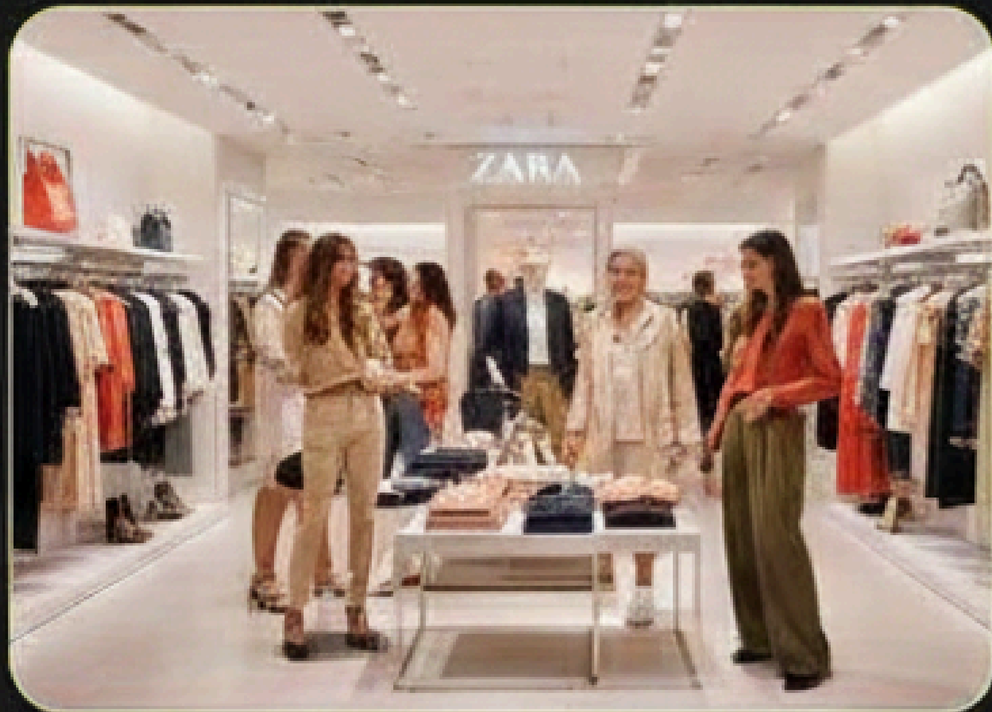
Fashion Forward, US