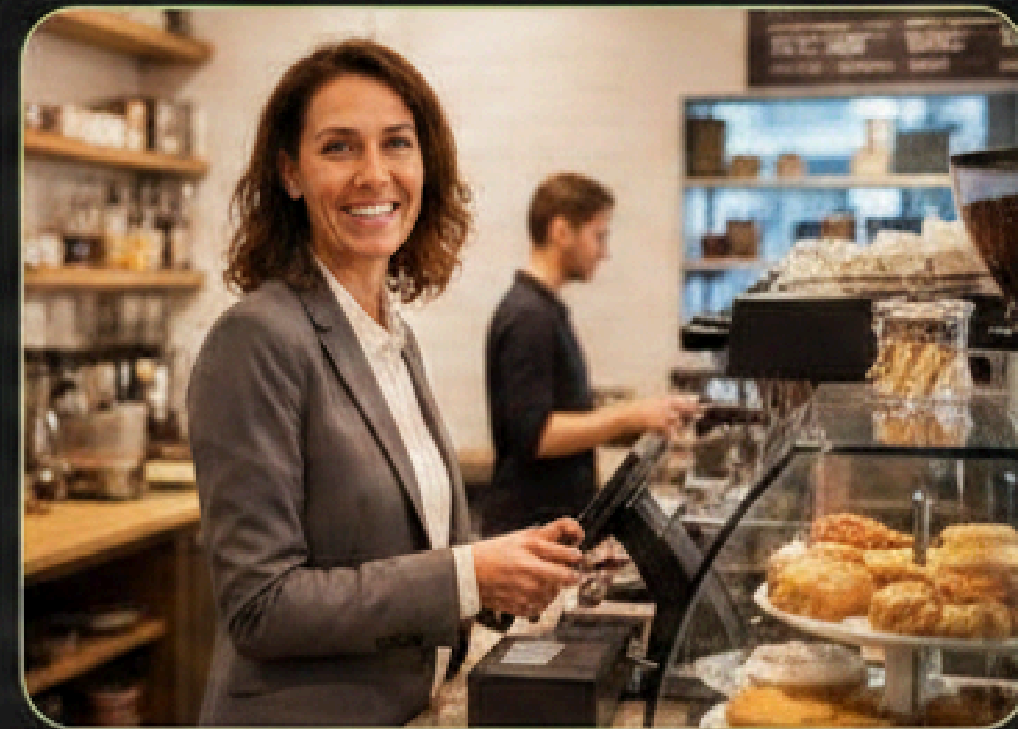
Local Cafe Owner, US