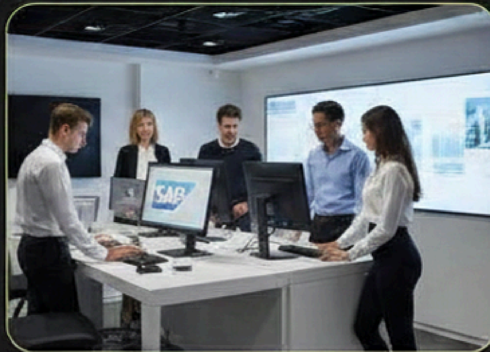
Tech Innovators, US