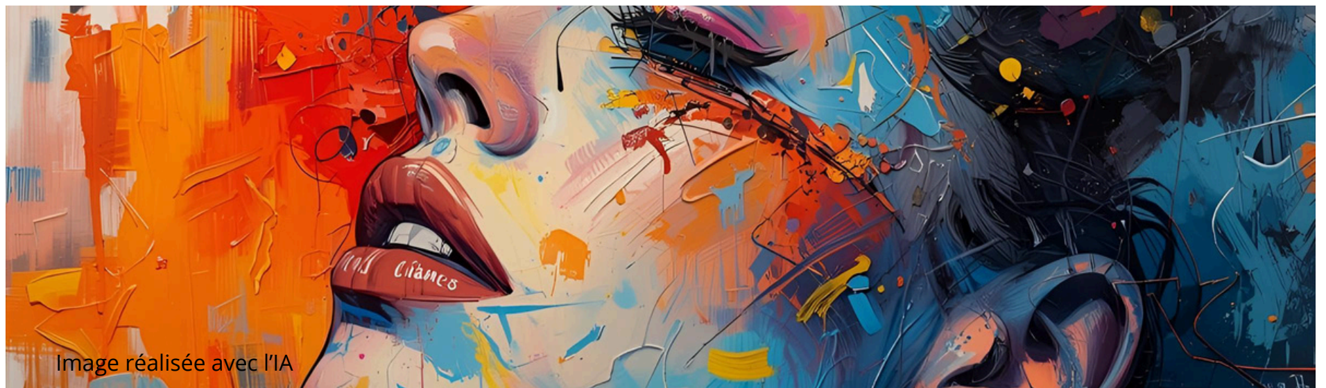
Image réalisée avec l'IA

L'émotion devient une palette, pas une vague incontrôlable. Et soudain, la voix retrouve de la liberté