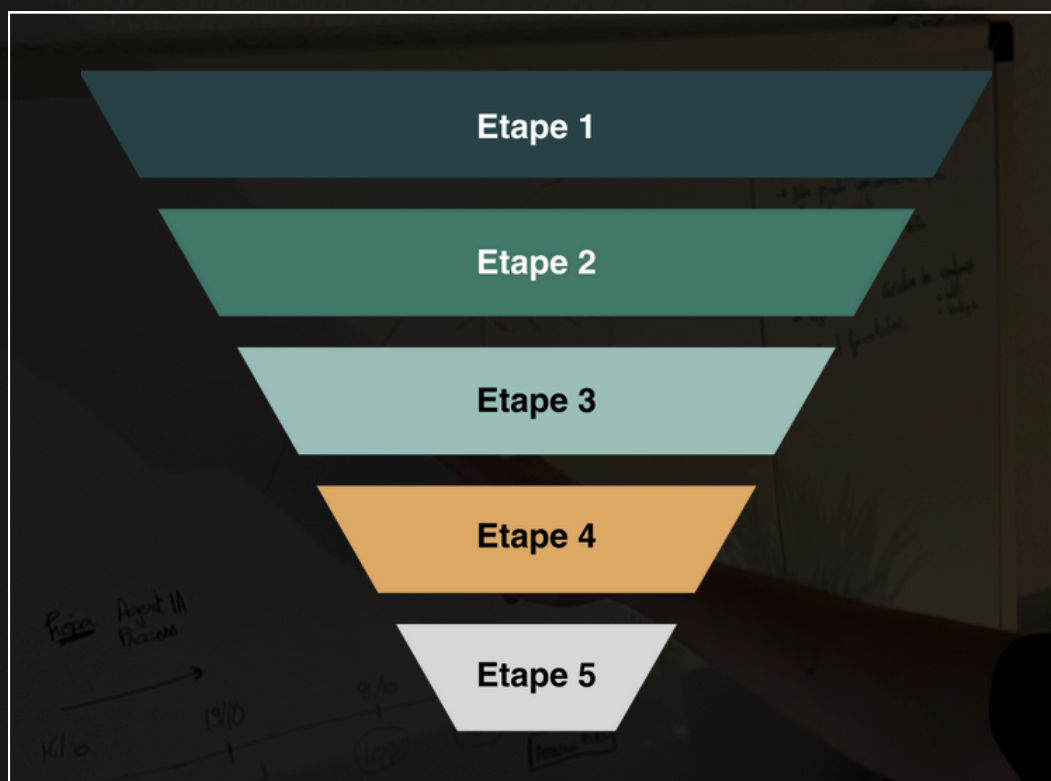
Les 5 étapes pour savoir investir en bourse.

Je vais simplement te partager les 5 étapes essentielles que je considère aujourd'hui comme indispensables pour investir sereinement sur le long terme.